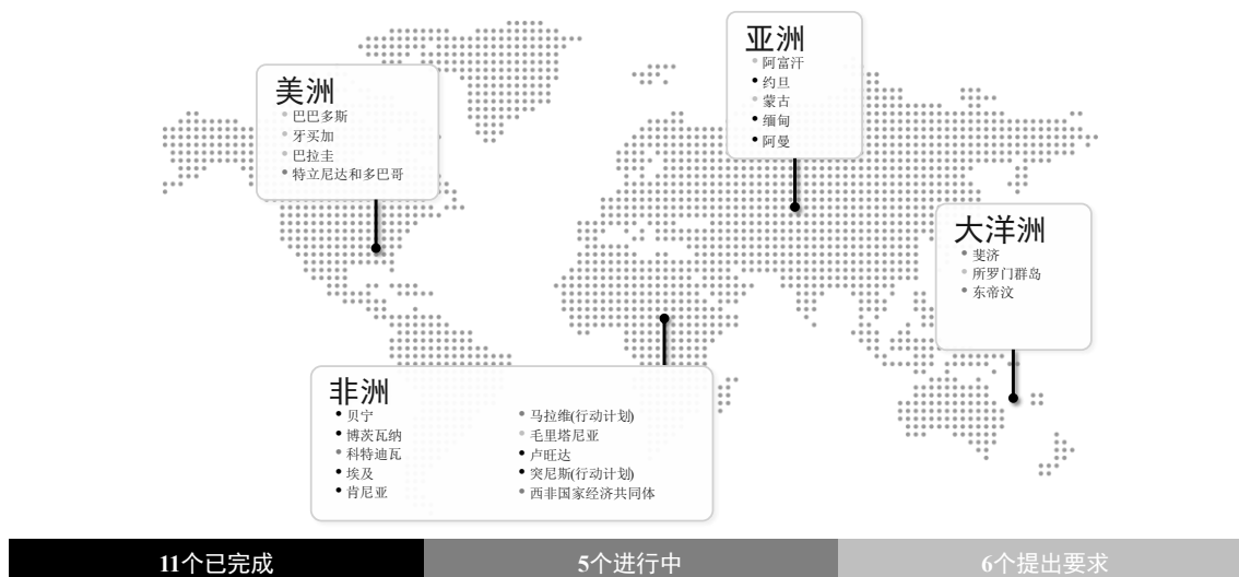
图 4 截至 2024 年 1 月贸发会议协助制定的行动计划和电子商务战略