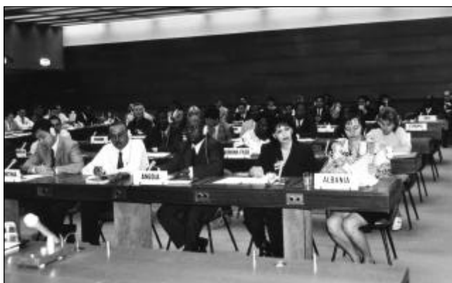
Fóto 2: Representantes de países en la reunión del Grupo consultivo del SIGADE

También en su decisión 462 (XLVII), la Junta pidió al Secretario General de la UNCTAD que examinara la posibilidad de establecer un fondo fiduciario del SIGADE a fin de garantizar la sostenibilidad financiera de la actividad central del programa SIGADE, así como las diversas opciones y modalidades de dicho fondo. En cumplimiento de dicha petición, el Secretario General decidió que se estableciera un fondo fiduciario del SIGADE a fin de garantizar la debida financiación de la actividad central del programa SIGADE, y sus otras actividades, con inclusión del desarrollo, el mantenimiento y la utilización del software, la capacitación en la gestión de la deuda y la creación de redes. Con respecto a