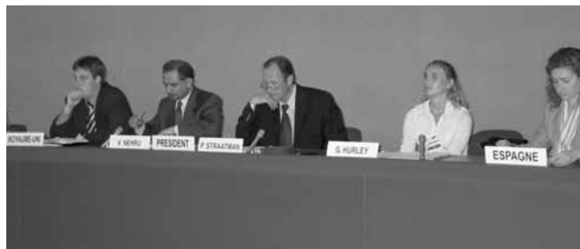
Grupo de expertos de la Conferencia sobre nuevas medidas de alivio de la deuda, entre los que figuran (de izquierda a derecha) representantes del Reino Unido, el Banco Mundial, la UNCTAD, EURODAD y España.

Durante la reunión del Grupo Consultivo del SIGADE, los países clientes, los donantes y la Secretaría de la UNCTAD examinaron las actuales y futuras actividades del Programa. También se presentó un informe de evaluación de las actividades correspondientes al período 2002-2005. Sobre la base del informe, el Programa presentará su nuevo plan de trabajo estratégico a los actuales y posibles donantes en una reunión de donantes que se llevará a cabo en 2006. En dicha reunión se determinará el financiamiento de un nuevo fondo fiduciario plurianual de donantes múltiples, que se establecerá en 2006. Durante la reunión del Grupo Consultivo, Noruega reafirmó su firme intención de prestar apoyo financiero en el futuro.