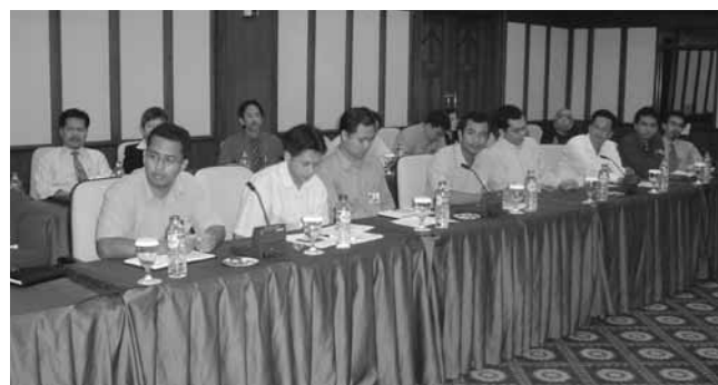
Participantes del taller sobre estadísticas celebrado en Indonesia.

Tanto el Banco de Indonesia como el Ministerio de Hacienda han instalado ya el sistema SIGADE y cuentan con bases de datos exhaustivas y actualizadas, que aportan los insumos para el Boletín de Estadísticas sobre la Deuda. En el caso concreto del Banco de Indonesia, cabe decir que empezó a utilizar el sistema SIGADE hace relativamente poco tiempo, después de veinte años de estar utilizando un sistema interno. Por otro lado, el Ministerio de Hacienda utiliza el SIGADE desde 1989 para registrar y seguir la evolución de la deuda pública externa.