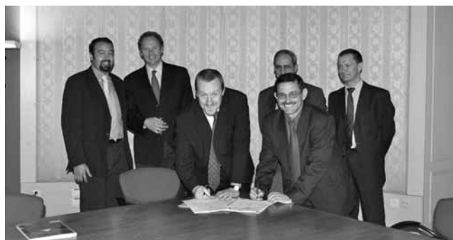
Firma del documento de proyecto, Banco Central de Argelia y UNCTAD.

El proyecto con el Ministerio de Hacienda de Argelia también comprende la instalación del SIGADE 5.3 junto con una capacitación completa y un apoyo global destinados a los usuarios del Programa en el Ministerio.