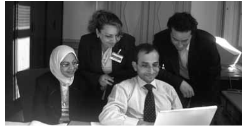
Representantes del Banco Central del Iraq y de Ernst & Young en un taller de la UNCTAD sobre TI celebrado en Ginebra.

la base de datos. Actualmente, consultores de Ernst & Young prestan asistencia a funcionarios iraquíes en relación con la entrada de datos sobre préstamos, mientras que la UNCTAD presta asistencia por conducto de la Línea de Urgencia del SIGADE. A pesar de la difícil situación por la que atraviesa el país, se han alcanzado notables progresos en el establecimiento de la base de datos. La UNCTAD continuará prestando asistencia técnica al Gobierno iraquí mediante nuevos programas de capacitación y servicios de asesoramiento, que serán objeto de un acuerdo de cooperación separado.