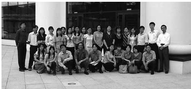
Taller en Viet Nam sobre estadísticas de la deuda.

La metodología del taller fue la misma que se utilizó en el taller de Indonesia (véase el artículo que figura más arriba). El resultado de este taller será un boletín estadístico semestral sobre la deuda externa pública y la deuda externa con garantía pública, en el que se aplicarán las normas y clasificaciones internacionales más recientes.