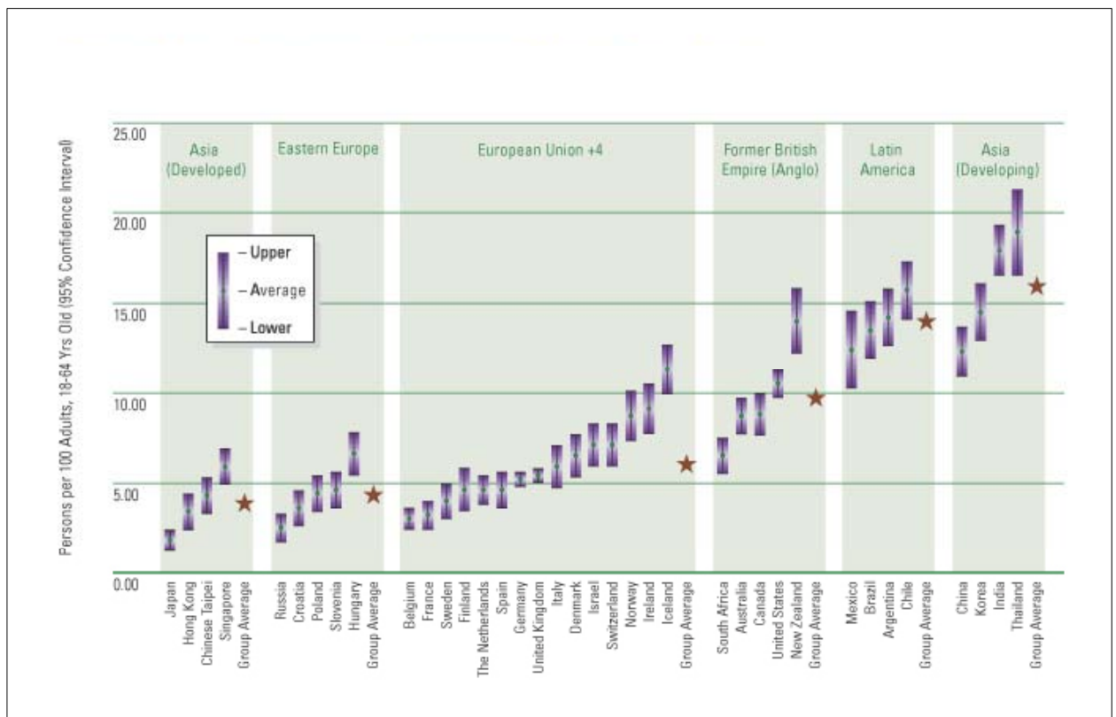
Figure 3. Activité entrepreneuriale dans les différentes régions du monde